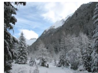
Blick ins Kaponigtal