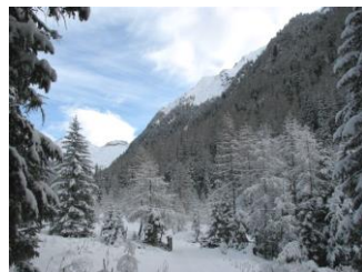
Blick ins Kaponigtal